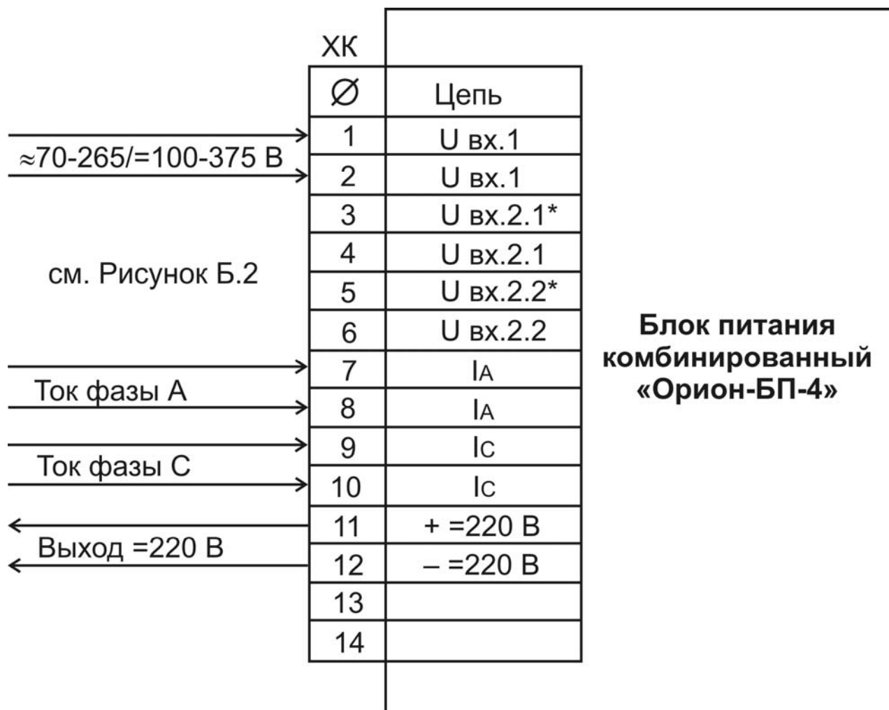
Рисунок Б.1 – Схема расположения клемм разъема ХК

Схема подключения блока питания «Орион-БП-4» к внешним цепям