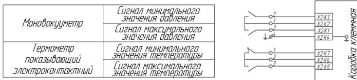
Рисунок Д.1 - Монтаж контрольных кабелей трансформаторов с термометром показывающим электроконтактным и мановакуумметром

Монтаж контрольных кабелей трансформаторов с термометром показывающим электроконтактным, реле газовым и маслоуказателем стрелочным электроконтактным приведен на рисунке Д.2.