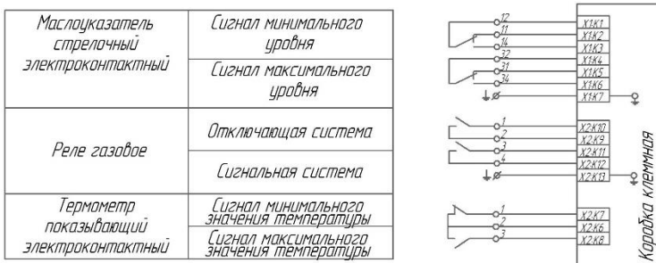
Рисунок Д.1 - Монтаж контрольных кабелей трансформаторов с термометром показывающим электроконтактным, реле газовым и маслоуказателем стрелочным электроконтактным